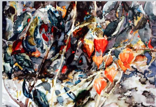
Früher Winter, Aquarell, 24 x 32 cm, 2003