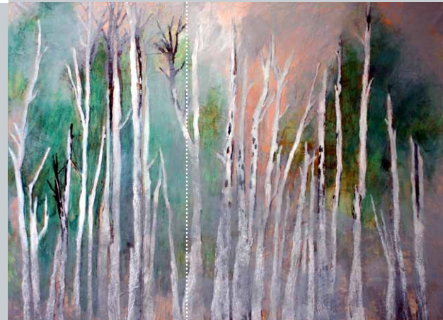
Russische Birken im Nebel, Acryl, Kreide, Zeichenkohle auf Leinwand, 108 x 146 cm, 2012

*1949 in Pleißmar (Sachsen-Anhalt), 1967 - 1972 Ausbildung zur Buchhändlerin und Töpferin, 1973 - 1979 Studium der Bildhauerei an der Kunsthochschule Berlin-Weißensee bei Werner Stötzer und Wilfried Fitzenreiter, seit 1979 freiberuflich, 1986 - 1989 Meisterschülerin an der Akademie der Künste bei Prof. Wieland Förster