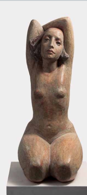
Felicitas, Terrakotta bemalt, 78 x 45 x 32, 2011

*1958 in Hildesheim, 1976 - 1978 Studium des »Mime Corporel« und modernen Tanzes an der Hochschule der Künste Berlin, 1976 - 1983 Studium der Germanistik und Theaterwissenschaften an der FU Berlin, 1987 - 1990 Studium der Bildhauerei an der UdK Berlin, 1987 - 1993 Studium der freien Malerei an UdK Berlin, 1994 Meisterschülerin bei Prof. Herrfurth, seit 1993 freischaffend tätig, seit 1996 Leitung von Workshops in Bildender Kunst und Performance, seit 2006 Dozentin an der Landesakademie für Schulkunst und Theater in Karlsruhe