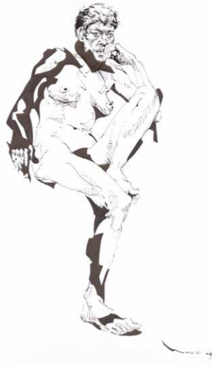
Sitzende sinnend, Feder, Pinsel, Tusche auf Papier, 28 x 20 cm, 2004