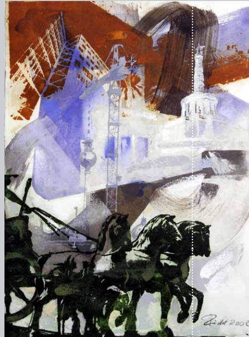
Kaleidoskop Berlin, Mischtechnik, 52 x 37 cm, 2008