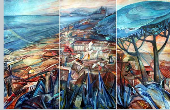
Die Provence (Triptychon), Collage, Öl und Acryl auf Leinen, 160 x 220 cm, 1999

*1947 Neustrelitz, 1965 Studium Mathematik und Physik, Volontariat in den Werkstätten der Deutschen Staatsoper Berlin, seit 1977 freie Theatermalerin u.a. für das Berliner Ensemble, Schauspielhaus Berlin, Schaubude (Puppentheater), Carrousel-Theater und Renaissance-Theater