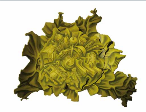
Stadtsalat, Acryl auf Biegesperrholz, 85 x 107 cm, 2011