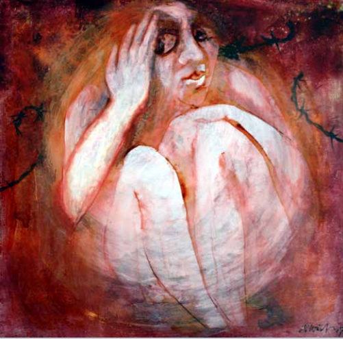
Verlassen, Ölgrafik, 30 x 30 cm, 2007