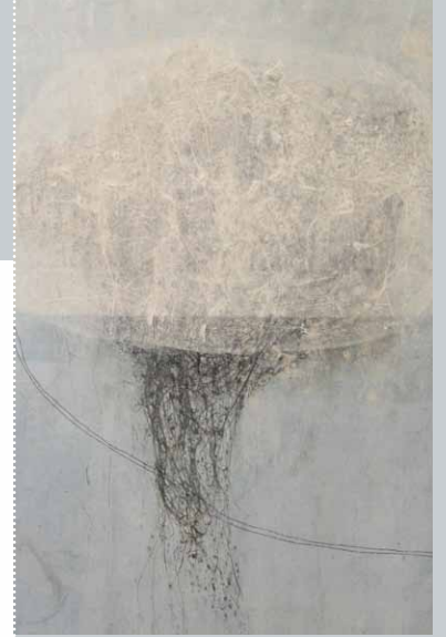
windsbraut 2 (Ausschnitt), Pigmente, Gesteinsmehle, transparente Papiere, Flachs und Wachs auf Leinwand, 200 x 160 cm, 2012

*1960 in Lutherstadt-Wittenberg, 1980 - 1985 Studium an der Kunsthochschule Berlin-Weißensee, Diplom im Fachbereich Keramik-Design, seit 1986 freiberuflich tätig, 2000 Gründung des Kunstvereins ARTiFEX e.V., seitdem Leitung der Kunstwerkstatt und der Kunstprojekte, seit 2006 Mitglied im Brandenburger Verband Bildender Künstler