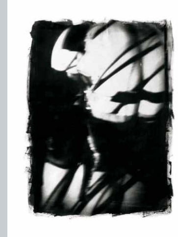
Gebunden, Foto - Silverprint Emulsion auf handgeschöpften Bütten, 76 x 56 cm, 1997

*1966 in Berlin, Lehre zum Fotografen, ab 1987 Studium der Technologie und Planung Druck an der Hochschule der Künste Berlin, seit 1990 als freiberuflicher Künstler tätig